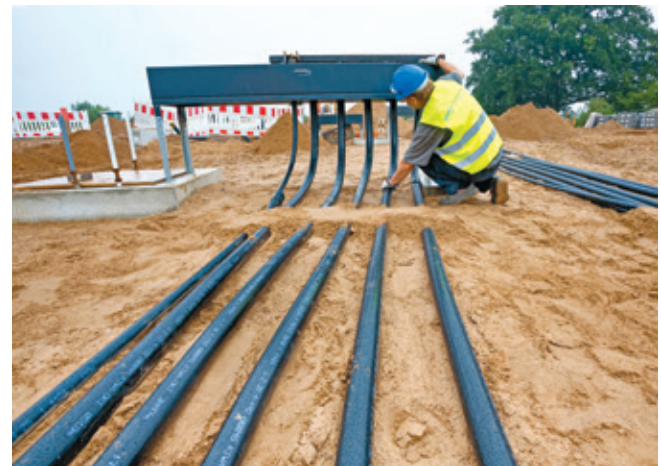
Verlegung der Leitungen zu den zukünftigen Zapfsäulen

Und natürlich fordert so eine wunderbare Idylle ihren Tribut. Wer hier eine oder zwei Tankstellen bauen will, hat die Anforderungen des Umweltschutzes auf höchstem Niveau zu erfüllen. Mit dem Wissen, all die entsprechenden Anforderungen einzuhalten und dem Umweltschutz in technisch anspruchsvoller Weise Rechnung tragen zu müssen, erhielt