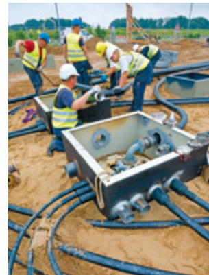
Einbringen der Füllleitung