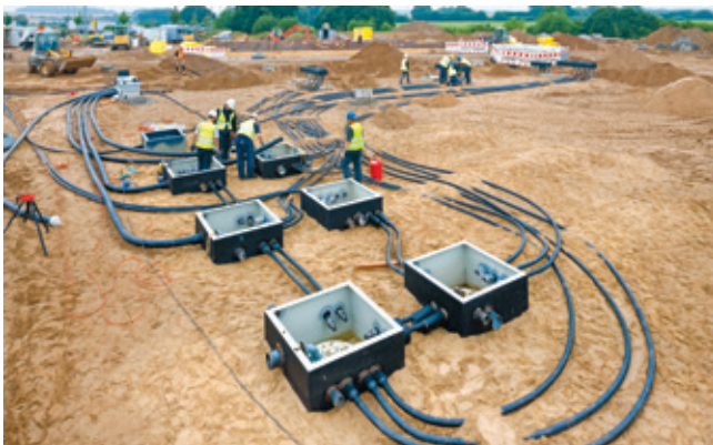
Gesamtansicht der Tankstellenbaustelle

Erste Termingespräche zwischen BRUGG und ARTELIA erfolgten im Februar 2013. BRUGG wirkte unterstützend bei der Erstellung des Rohrplans für die Nord-Seite. Für alle Produktleitungen wurden doppelwandige SECON®-X Leitungen geplant. BRUGG erhielt zunächst den Auftrag über die Lieferung des Materials für die Nordseite. Die spiegelgleiche Zwillingstankstelle wurde zeitversetzt ebenfalls mit SECON®-X verrohrt.