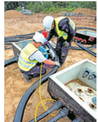
Biegen der Rohrleitung