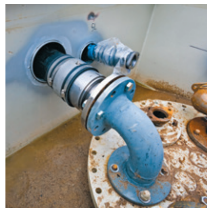
Fertig montierte Anschlussverbindung