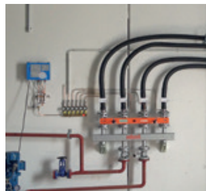
Fertig montiertes Leckanzeigesystem mit Ferndiagnose