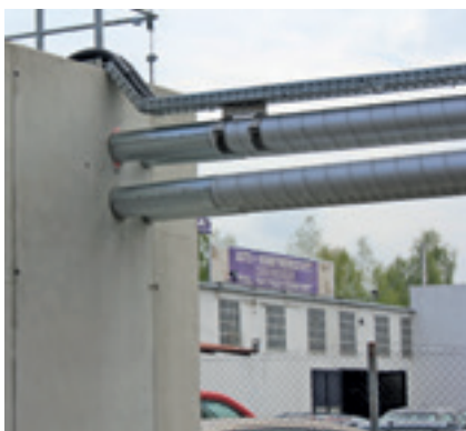
Oberirdische Verlegung in einer Rohrbrücke

Für die Befüllung der Tanks des Reserve-Spitzenheizkraftwerkes in der Oberaustraße sind 11 m FSR 60/83 (DN 50) verlegt worden. Weitere 86 m FSR 39/60 (DN 32) übernehmen die Verteilung von den zwei