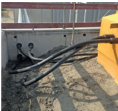
Verrohrung des Tanks am Reserveheizwerk