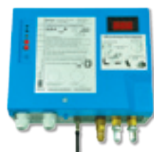
LOD-Leckanzeiger mit integriertem Mobilfunkmodul (DTM)

falls ausgetauscht werden müssen. Dies reduziert die Zeit der Wartung und schließt aus, dass eine weitere Anfahrt erforderlich ist. Mit der Leckanzeiger-Online-Diagnose setzt BRUGG neue Maßstäbe bei Wartung und Service!