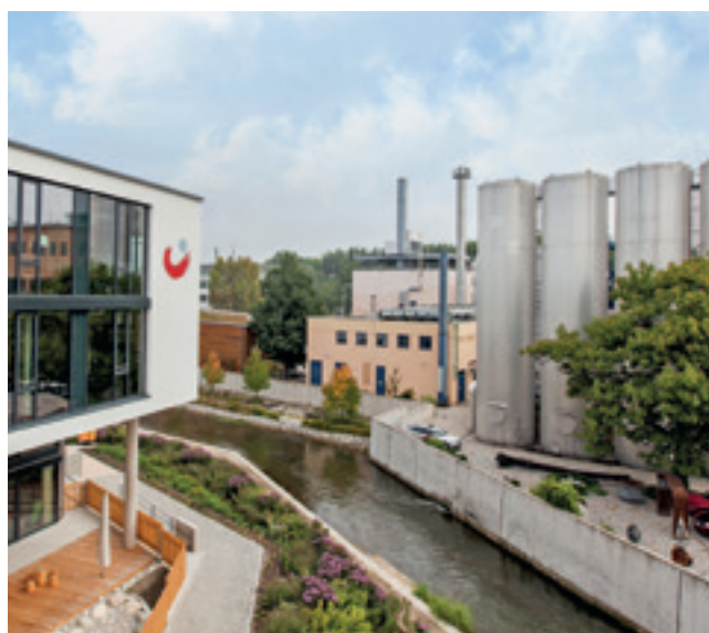
Hauptgebäude der Stadtwerke Rosenheim

Das Müllheizkraftwerk in Rosenheim kann mit Müll, Heizöl oder Gas betrieben werden. Für den sicheren unterirdischen Transport des Öls von der Betankungsfläche in das Gebäude sorgen 30 m FLEXWELL-