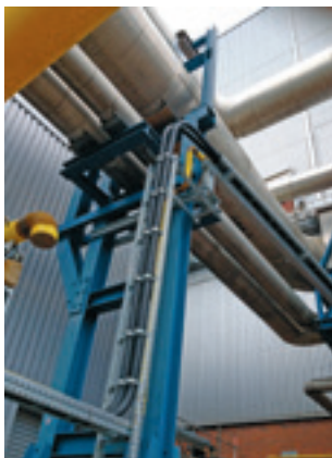
Keine Formteile bei Richtungswechseln erforderlich

Darüber hinaus wurde die Heizölleitung aus Sicherheitsgründen als doppelwandige und überwachbare Leitung ausgelegt: Nichts passte hier besser als FLEXWELL-Sicherheitsrohr®.