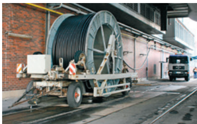
Rohrverlegung von der Trommel direkt auf die Kabelpritschen

Mitte März 2013, bei winterlichen Temperaturen und ungemütlichen Wetterverhältnissen, war für BRUGG Rohrsysteme das erste Zeitfenster von einer Woche vorgesehen, um die erste Teilstrecke von 2 x 540 m in Kabelpritschen zu verlegen. Mithilfe einer Hebebühne wurden die Monteure auf eine Höhe von 4 m gebracht, um die ferngesteuerte Verlegung per Zugseil zu begleiten. Hierbei war es wichtig, den intern weitergeführten Schienenverkehr nicht zu behindern. Gleich zu Beginn mussten ein Gebäudevorsprung und ein Höhenunterschied von +1,50 m überwunden werden. Obwohl die Vorarbeiten der anderen Gewerke länger gedauert haben und unser Zeitfenster dadurch verringert wurde, konnte der große Bauplan eingehalten werden.