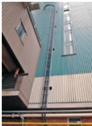
Steigleitung an der Rauchgasreinigungsanlage