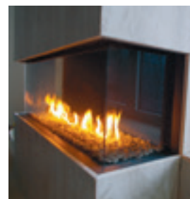
Gemütliches Feuer im Propankamin