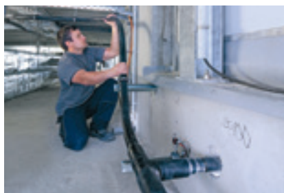
Dank hoher Flexibilität problemlose Verlegung mit mehrfacher Richtungsänderung