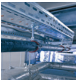
Einfache Fixierung der Rohrleitung mit Systemtechnik

Der zuvor gut geplante und festgelegte Trassenverlauf zeigte vor Ort, dass jede Theorie nur so gut ist, wie es die tatsächlichen Gegebenheiten in der Praxis vor Ort erlauben. Die Rohrtrasse wurde ständig geändert, weil eine Verlegung nach Plan nicht möglich war. Im Kellerbereich mussten die doppelwandigen Rohre durch Versorgungsräume, Flure und sanitäre Einrichtungen verlegt werden; und dies immer knapp unter der Decke geführt, die zum größten Teil abgehängt und