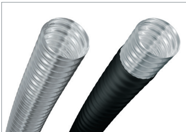
NIROFLEX® CNW ohne und CNT mit Schutzmantel PE-LD