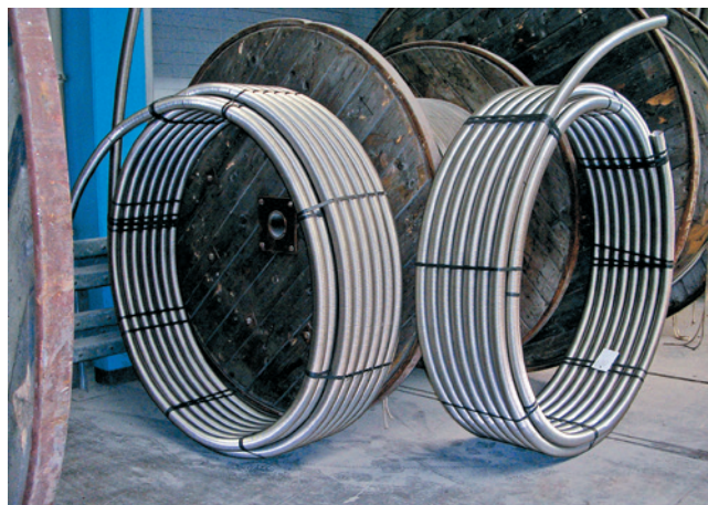
NIROFLEX® lieferbar als Ring oder auf Trommel