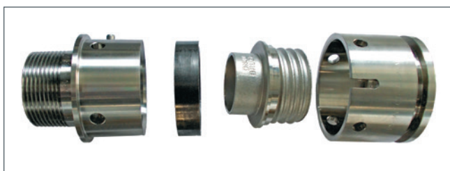
NIROFLEX® Anschlussverbindung GRAPA-S